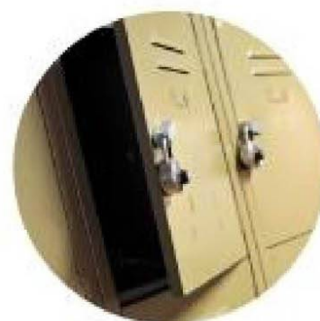
Камера хранения для спортивного инвентаря и багажа Бесплатно