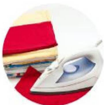
Стирка / глажение / мелкий ремонт одежды по спец.ценам