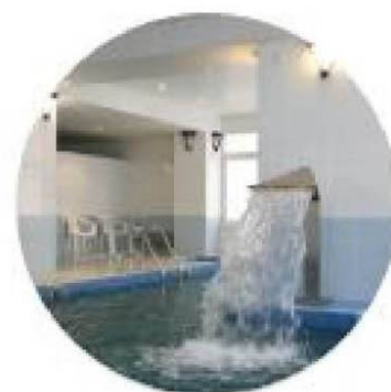
Бассейн и сауна

Гостиница АМАКС «Юбилейная» расположена в центре Автозаводского р-на. Рядом с нами находятся крупные спортивные сооружения города. Телефон отдела бронирования: 8 (8482) 37-20-88, 36-60-66 Эл.почта: bron-tlt@amaks-hotels.ru