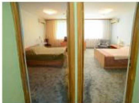
Номера Эконом от 750 руб/чел. с завтраком