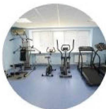
Тренажерный зал Бесплатно