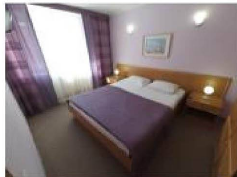
Улучшенные номера от 1000 руб/чел. с завтраком