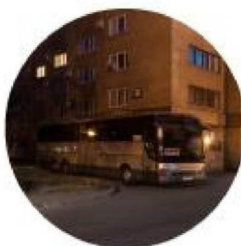
Охраняемая стоянка для автобуса команды