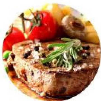
Обед от 250 руб/чел. Ужин от 200 руб/чел.